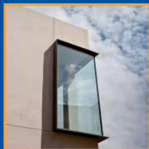
Centre Cívic de Vilabertran Pàg. 6-7