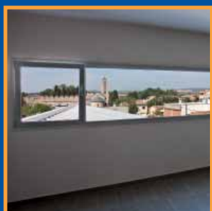
Centre Cívic de Vilabertran Pàg. 4-5