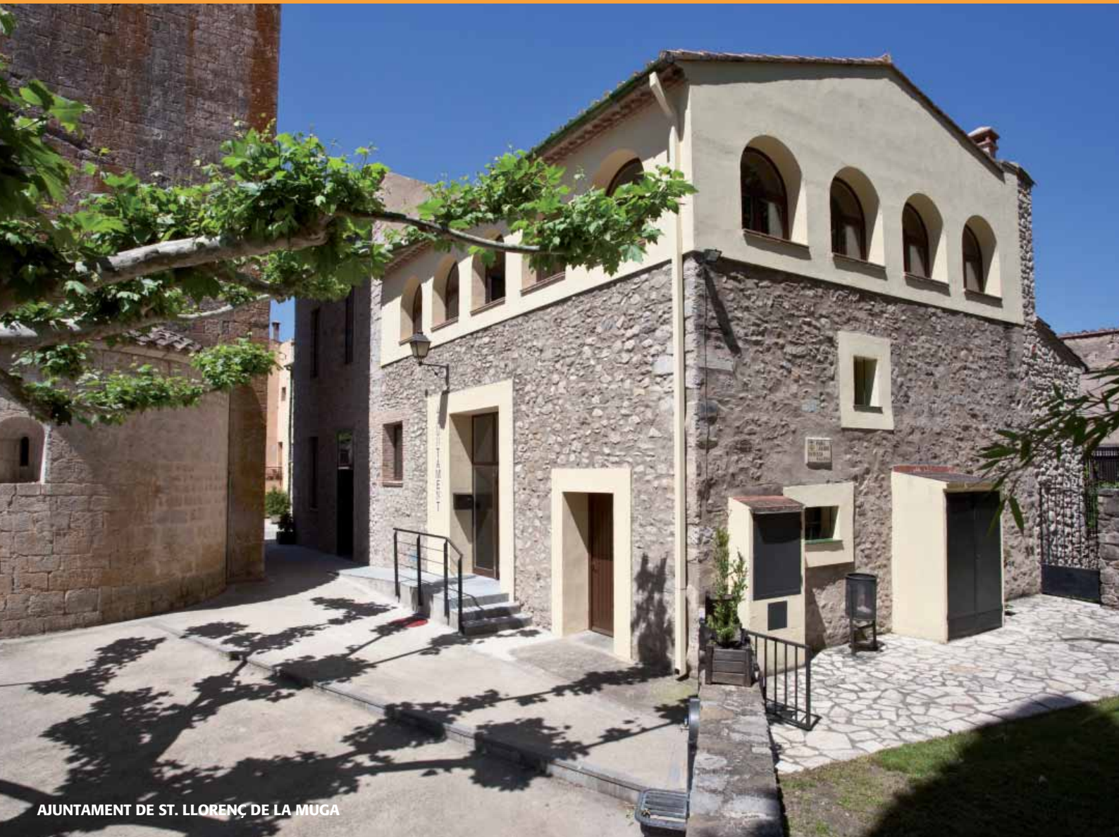
AJUNTAMENT DE ST. LLORENÇ DE LA MUGA