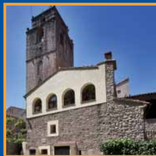
Reforma de l'Ajuntament de St. Llorenç de la Muga Pàg. 8-9