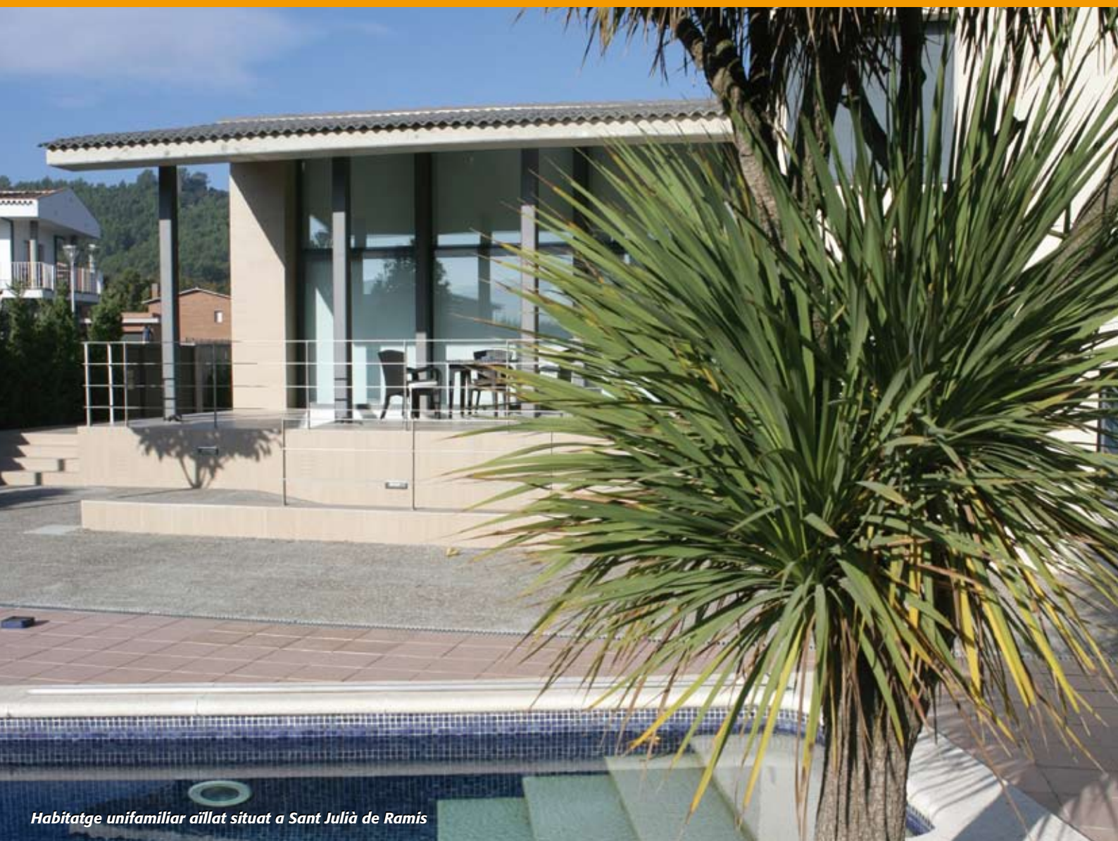
Habitatge unifamiliar aïllat situat a Sant Julià de Ramis