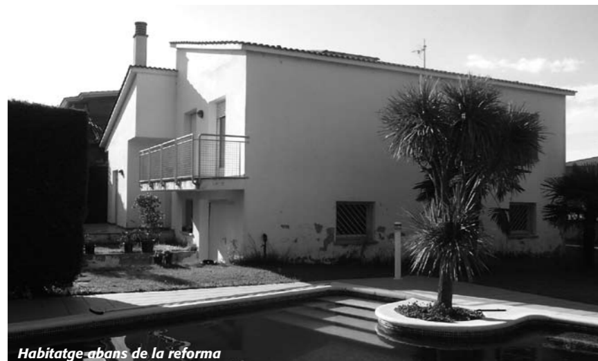
Habitatge abans de la reforma