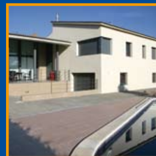
Habitatge unifamiliar aïllat situat a Sant Julià de Ramis Pàg. 10-11