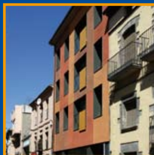
Edifici de 3 habitatges i local comercial al carrer Major de la Jonquera. Pàg. 8-9