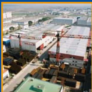
La ferralla i els seus compromisos Pàg. 2-4-5