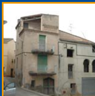
Soterrament de línies elèctriques de baixa tensió: una reflexió Pàg. 8-9