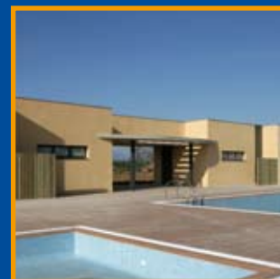
Projecte d'una piscina a Garrigàs (Alt Empordà) Pàg. 10-11