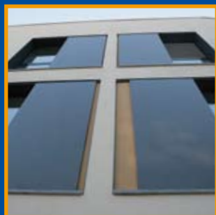
Edifici plurifamiliar de cinc habitatges entre mitgeres al Carrer Besalú, 5 de Lladó Pàg. 6-7