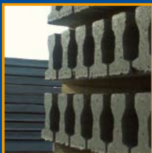
Grup Pujol Pàg. 4-5